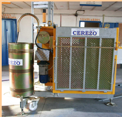
Detalle Conjunto Máquina