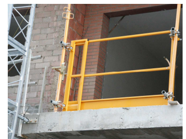
Detalle Puerta Desembarco Planta